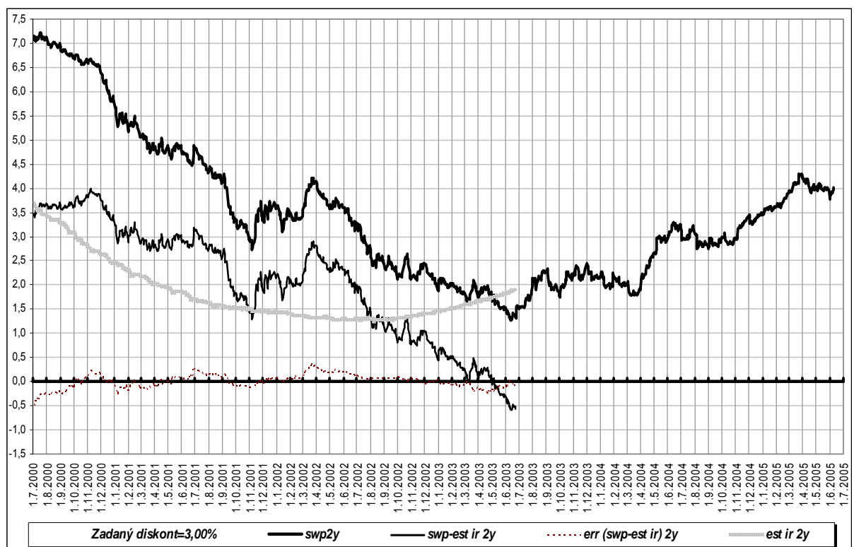
Obrázek č. 2: Průběhy jednotlivých časových řad vstupujících a vystupujících ve vztahu (2). Horní je záznam kurzu swp 2Y na 3M LIBOR-USD, pod ním je průběh pravé strany vztahu (2), šedý je průběh \frac{1}{n} \sum_{j=1}^n \frac{i_{t+j\Delta}}{(1+d\Delta)^j} , čárkovaný kolem nulové osy je průběh chyby \varepsilon_{t,T,d} ze vztahu (2).

Časové průběhy jednotlivých veličin následují na obrázku č. 2.