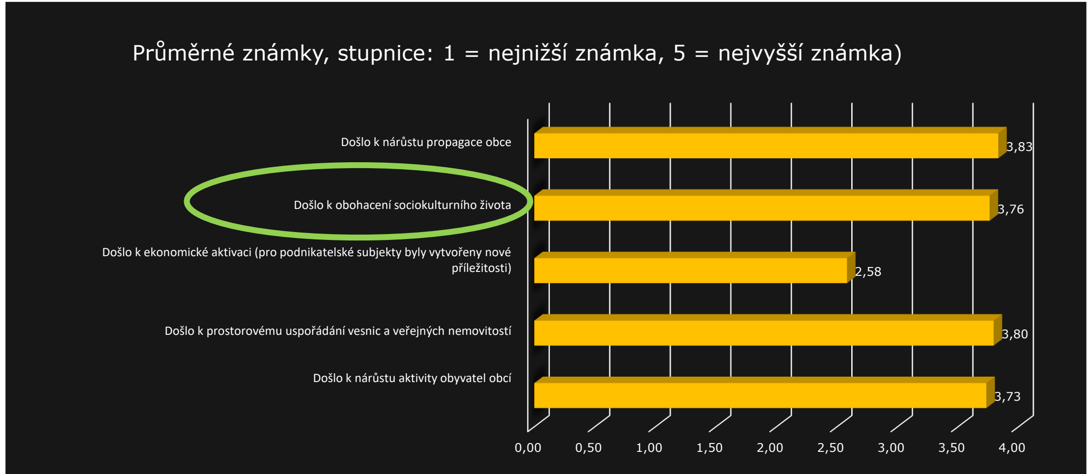
Graf 3. Hodnocení oblastí, kde by mohlo dojít k přínosu pro OBEC v důsledku implementace POV