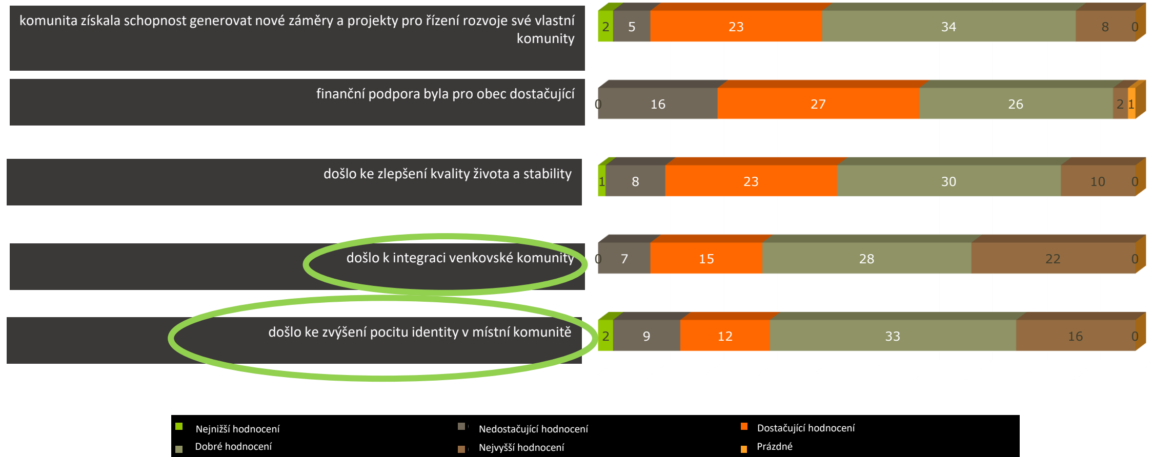
Graf 2. Hodnocení oblastí, kde by mohlo dojít k přínosu pro venkovskou společnost v důsledku implementace POV